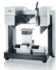
Drop Shape Analyzer – DSA100

Technical note: TN312d Industry section: alle Author: FT Date: 07/2007